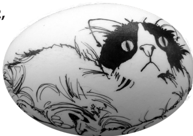
Osterei gestaltet von Karin Sichts

13 Ausstellerinnen und Aussteller präsentieren nach einem Jahr Pause wieder ihre fantasievollen Kreationen rund um das Ei. Ausgeblasene Eier (bitte mitbringen) können jeweils von 11:30 Uhr bis 13:00 Uhr gestaltet werden.