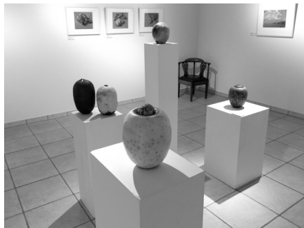
Blick in die Ausstellung