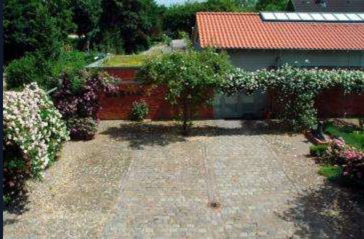
Magazin und Halle – Ansicht vom Hofplatz