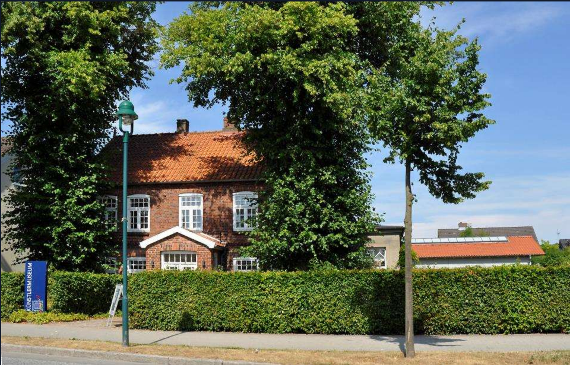
Künstlermuseum – Atelierhaus Blunck, Ansicht vom Teichtor