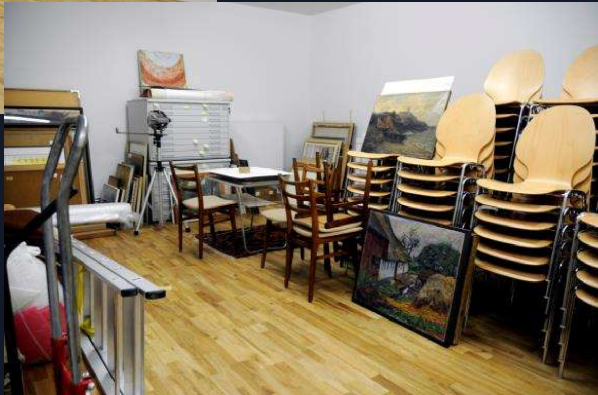
Problematische Lagersituation im neuen Magazin II