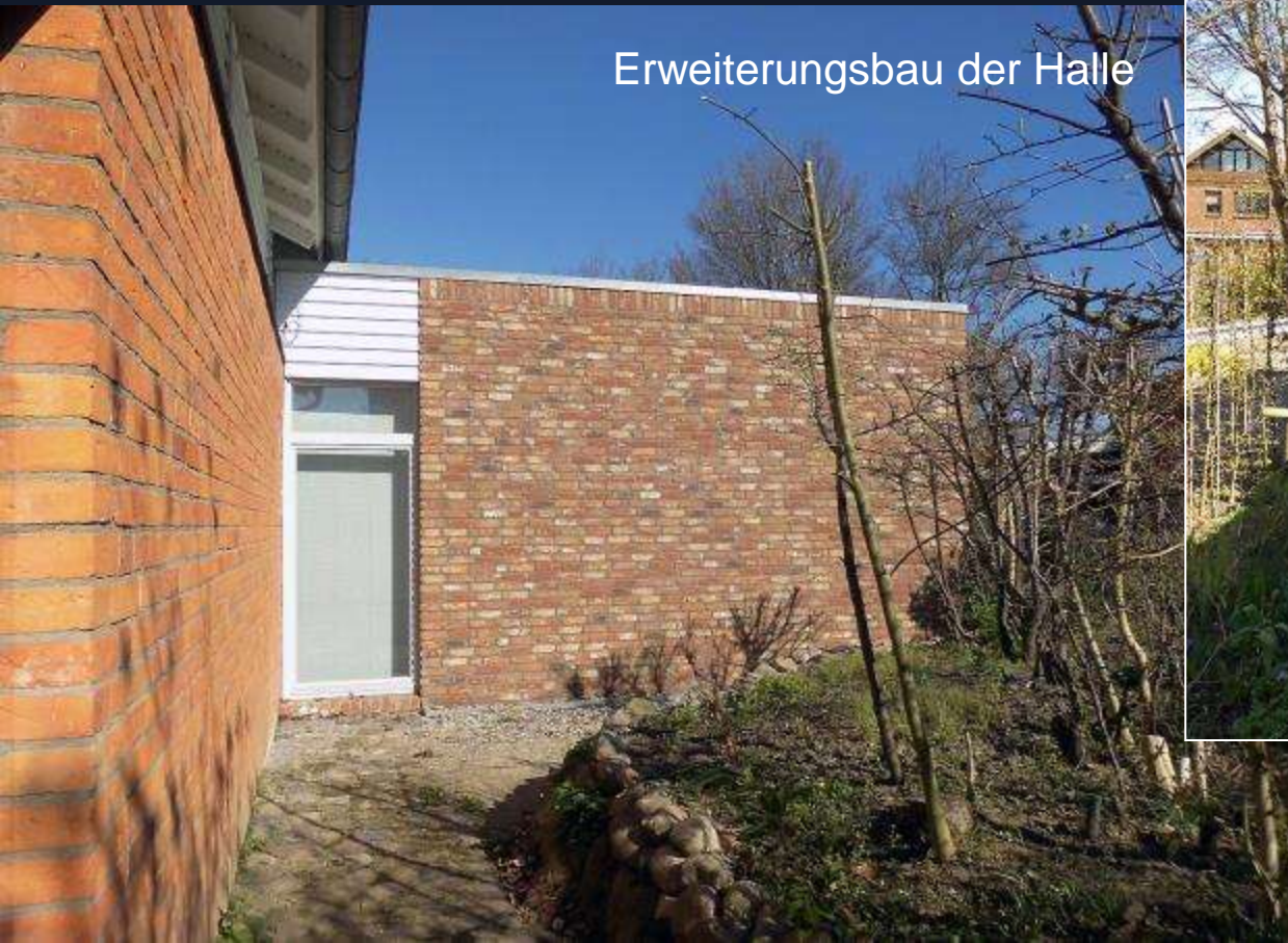
Erweiterungsbau der Halle