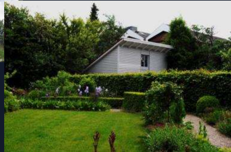
Umzug Haus III „Das Fliegende Haus“