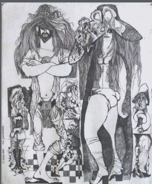
Jeane Fliester, Straßenaffe , 1977, Radierung Künstlermuseum Heikendorf-Kieler Förde © 2023 VG Bild-Kunst, Bonn