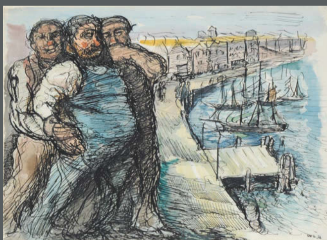
Werner Lange, Drei dicke Fischer , 1936, Aquarell über Feder Nachlass Baldrich

Weitere Künstlerinnen und Künstler warten auf Ihren Besuch. Lassen Sie sich überraschen. So wie die Musik ihre Töne und Zeichen, die Sprache ihre Laute und Schriften hat, so hat auch das Bild seine Gestaltungs- und Formelemente.