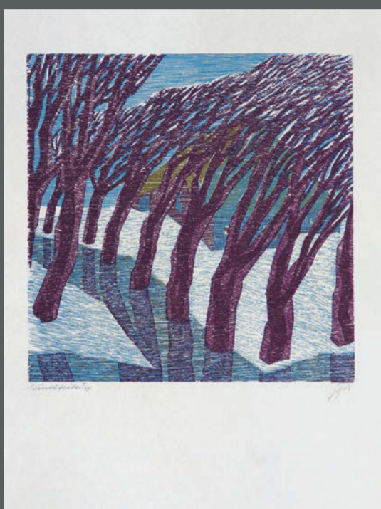
Gerhard Hermanns, Windsäule (aus dem Zyklus Köppel und Vordämpe ), 1984, Farbholzschnitt, © H. Hermanns

Die Fotos, die wir bei dieser Veranstaltung machen, können zur Darstellung unserer Aktivitäten auf der Webseite, auf unseren Social-Media-Kanälen sowie in Printmedien veröffentlicht werden. Mit Ihrer Teilnahme an der Veranstaltung stimmen Sie dem zu.